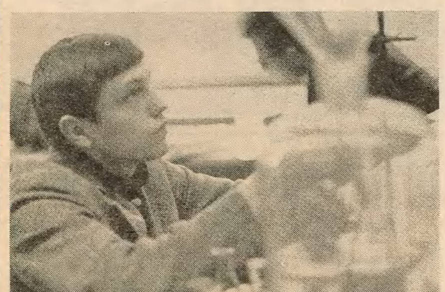
На здымках: студэнты другога курса хімічнага факультэта ў час лабараторных заняткаў па аналітычнай хіміі.

Прыцягваюць увагу рубрыкі, цікавыя загадоўкі ў «Алгарытме»; «Што за пяціражкі?», «Праблемы інтэрната» і іншыя. Нельга сказаць, каб усё было добра, але на сваіх памылках «Алгарытм» вучыцца. Л. ДРУЗЕВА.